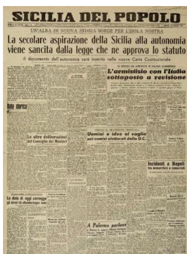
Figura 1: Sicilia del popolo (16 maggio 1946)

La Commissione per la vigilanza sulla Biblioteca che assume altresì, in funzione di specifica normativa interna, le funzioni di Comitato parlamentare per l'Archivio storico, nella seduta n.17 del 22 aprile 2026, ha espresso l'intendimento di organizzare, a partire da una valorizzazione dell'importante materiale bibliografico e documentale posseduto dalla Biblioteca, un programma di iniziative di promozione della politica e delle istituzioni, in un percorso ideale che parte dall'80esimo anniversario dello Statuto (15 maggio 1946) e che conduce alle celebrazioni per l'80esimo anniversario della prima seduta dell'Assemblea (25 maggio 1947).