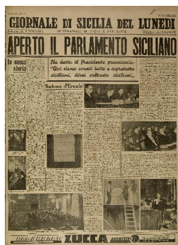
Figura 2: Giornale di Sicilia (26 maggio 1947)