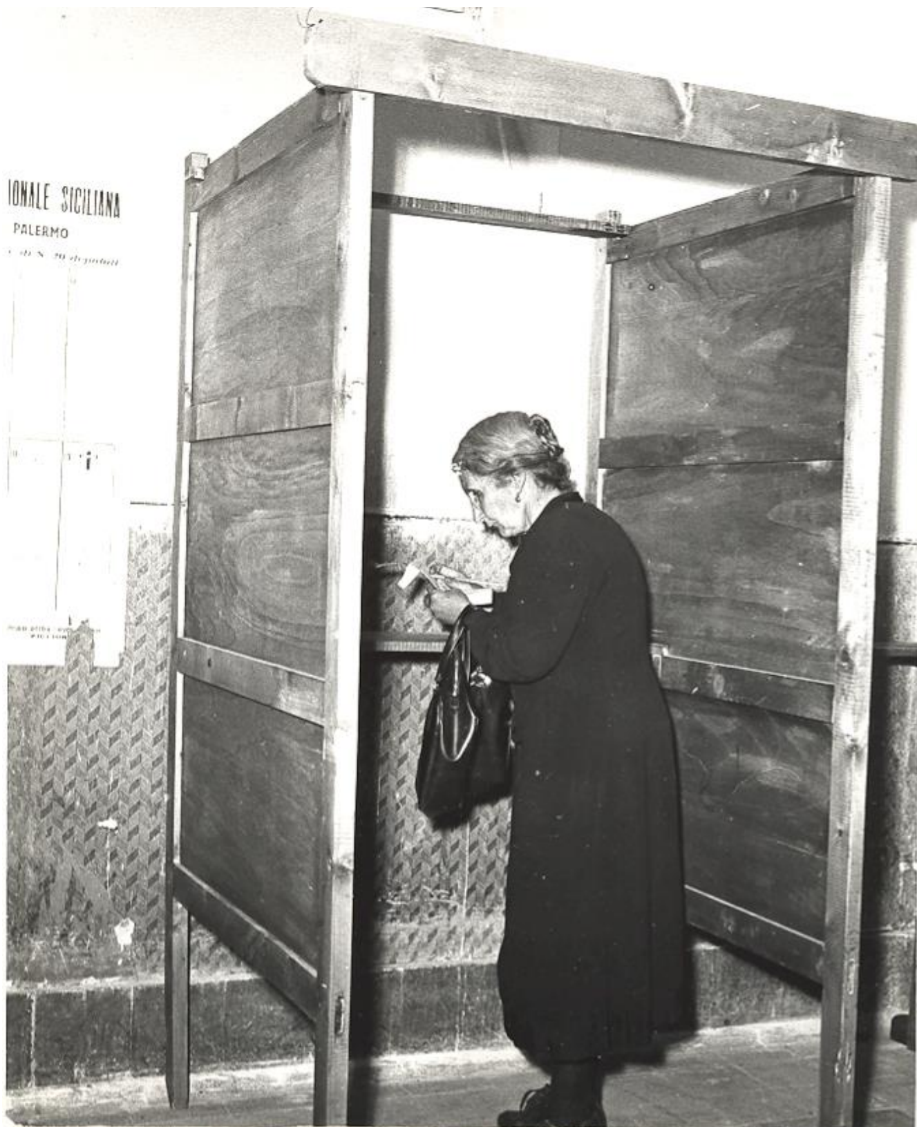
Donna al seggio per l'elezione dell'Assemblea Regionale Siciliana II legislatura 1951/55