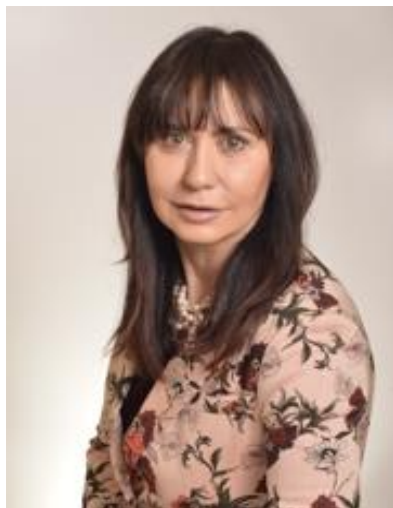
PAPTHEU URANIA GIULIA ROSINA

Regione di elezioni: Lazio Gruppo Movimento 5 Stelle dal 27 marzo 2018 al 3 luglio 2018 Segretario dal 3 luglio 2018 al 16 ottobre 2019 dal 17 ottobre 2019 al 12 ottobre 2022 Incarichi Segretario provvisorio della Presidenza del Senato dal 23 marzo 2018 al 28 marzo 2018 Componente VIII Commissione permanente (Lavori Pubblici, Comunicazioni) dal 21 giugno 2018 al 28 luglio 2020 Segretario dal 29 luglio 2020 al 12 ottobre 2020