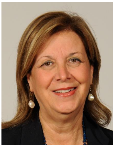
LA ROCCA RUVOLO MARGHERITA