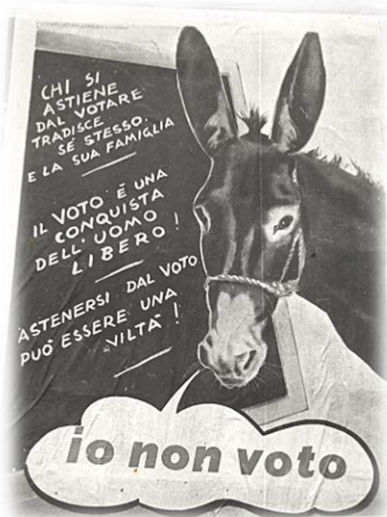
Manifesto elettorale anni '50

«L'esercizio del voto è un obbligo al quale nessun cittadino può sottrarsi senza venir meno ad un suo preciso dovere verso il Paese in un momento decisivo della vita nazionale.