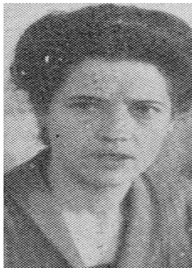
MARE IN PONI GINA

Componente V Commissione Legislativa (Lavori Pubblici, Comunicazioni, Trasporti e Turismo)