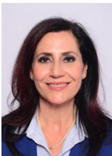
MARINO MARIA STEFANIA

Componente Commissione Parlamentare di inchiesta sulle attività illecite connesse al ciclo dei rifiuti e su altri illeciti ambientali e agroalimentari dal 7 settembre 2023