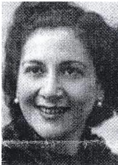
GIGANTI IN CURELLA INES