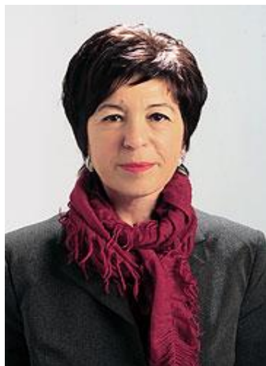
CASTIGLIONE MARIA GIUSEPPA

Senatrice CASTIGLIONE MARIA GIUSEPPA Nata a San Vito Lo Capo (TP) il 10 novembre 1955 Professione medico neurologo