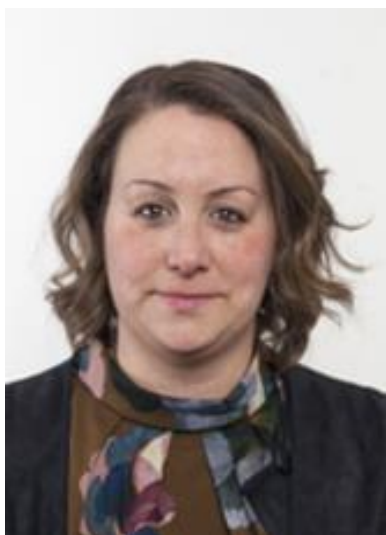
CANCELLERI AZZURRA PIA MARIA

Presidente della Camera dei deputati dal 16 marzo 2013 al 22 marzo 2018 Presidente della Giunta per il regolamento dal 2 aprile 2013 al 22 marzo 2018 Presidente dell'Ufficio di Presidenza dal 21 marzo 2013 al 22 marzo 2018 Presidente della Conferenza dei Presidenti di Gruppo dal 19 marzo 2013 al 22 marzo 2018 Presidente della commissione di studio per la redazione di principi e linee guida in tema di garanzie, diritti e doveri per l'uso di internet dal 28 luglio 2014 al 22 marzo 2018 Presidente della commissione "Jo Cox" sull'intolleranza, la xenofobia, il razzismo e i fenomeni di odio dal 10 maggio 2016 al 22 marzo 2018